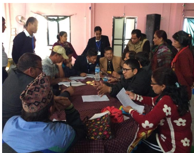
एकिकृत योजना तर्जुमा गोष्ठी