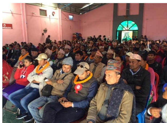
सार्वजनिकीकरण समारोहका भलकहरु